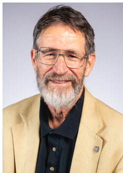
George Smith (Premio Nobel Química)

Tema de Presentación: El rol de los científicos en luchar contra la crisis climática