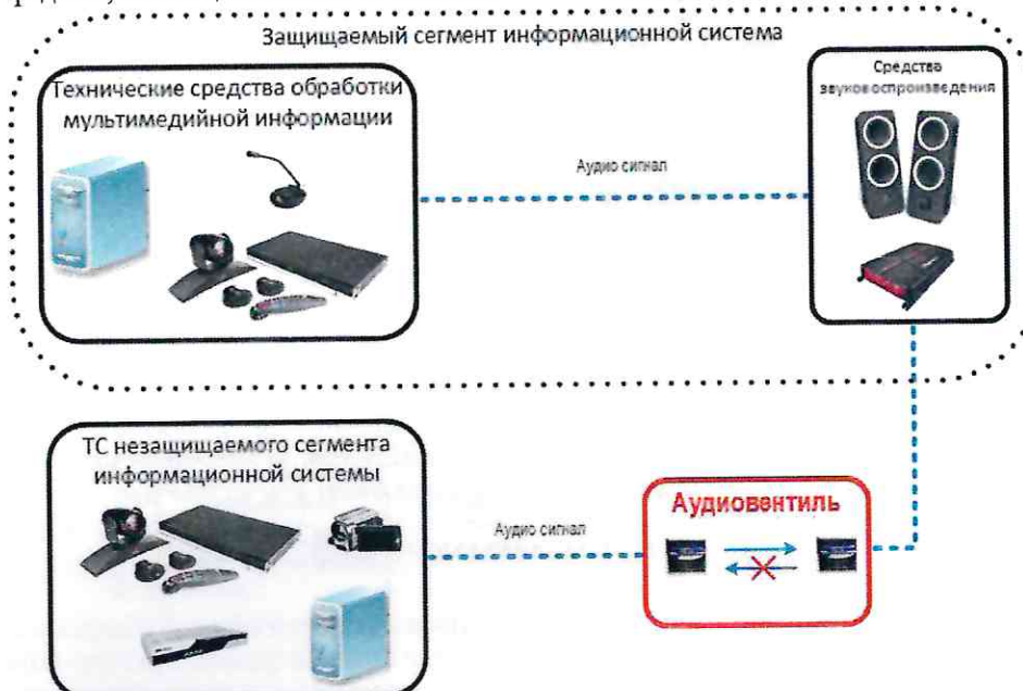
Рис. 3. Пример схемы подключения устройства однонаправленной передачи аудиосигнала «Аудиоventиль»