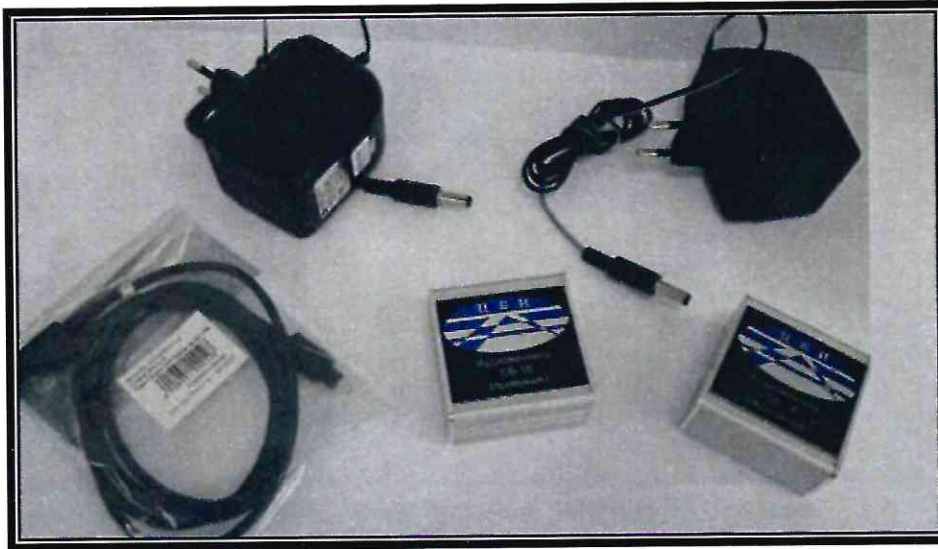
Рис. 2. Устройство однонаправленной передачи аудио сигнала «Аудиоventиль»

Устройство «Аудиоventиль» (см. рис. 2), конструктивно состоит из модуля передатчика и модуля приемника. Вход передатчика и выход приемника обеспечивают подключение через разъем типа MiniJack 3,5 или XLR. Модули изделия соединяются между собой оптоволоконным кабелем через разъем типа Toslink длиной от 1 до 5 метров.