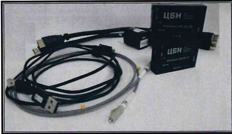
Рис. 4. Устройство однонаправленной передачи видеoinформации «Медиадиод»

В СОПИ «Медиадиод» требуемая информация хранится в микросхеме EDID (Extended Display Identification Data) и содержит сведения о возможных