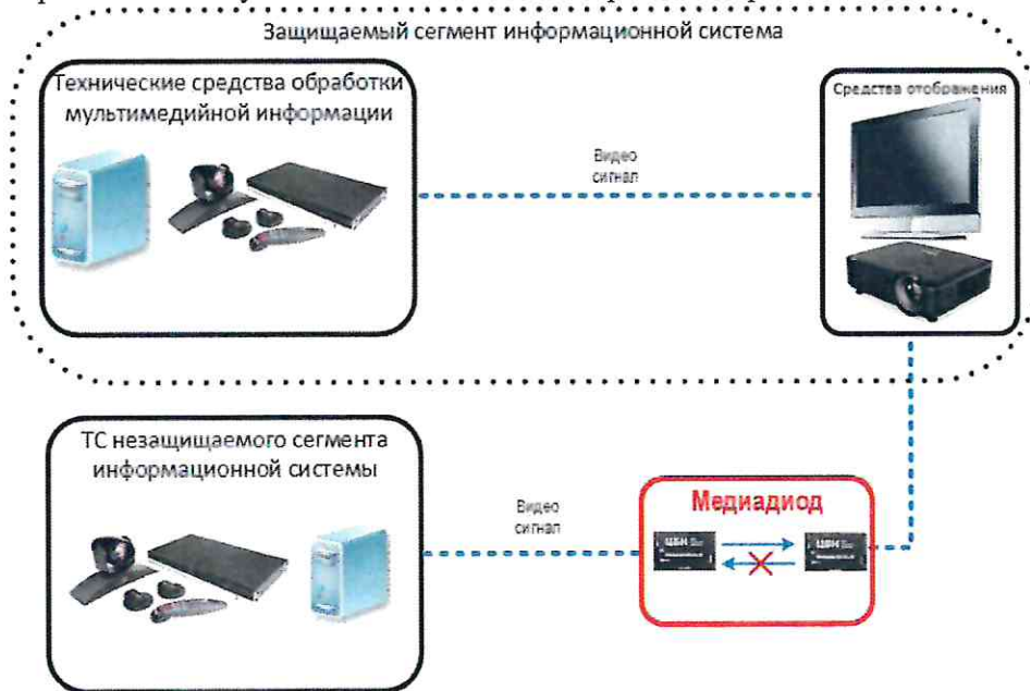
Рис. 5. Схема подключения устройства однонаправленной передачи видеосигнала «Медиадиод»

Устройство «Медиадиод» позволяет отделить технические средства, являющиеся источником видеосигнала и предназначенные для обработки информации более высокого уровня значимости, от сегмента более низкого уровня значимости. Пример схемы подключения приведен на рис. 5.