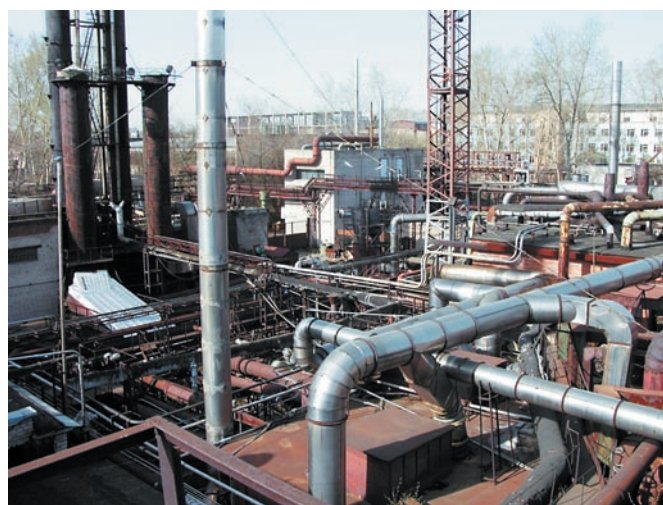
рисунок 2. Система имитации высотных условий отдела 216