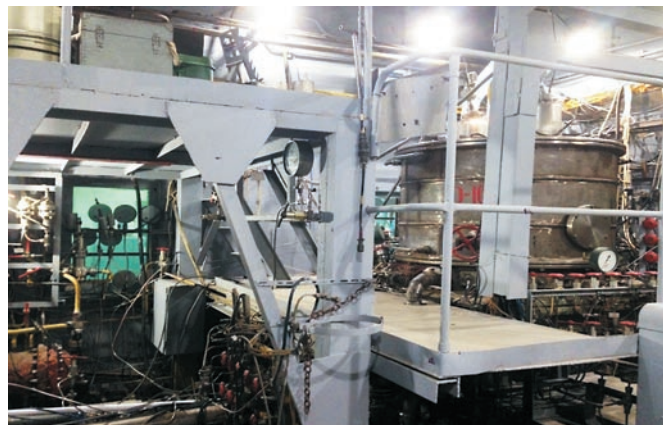
рисунок 1. Огневой бокс стенда 10Б

Эти проблемы были решены при создании барокамерного стенда 10Б (рисунок 1) с системой имитации высотных условий (рисунок 2). В настоящее время стенд используется при контрольно-выборочных испытаниях двигателей с тягой 5 кг для разгонного блока «ФРЕГАТ».