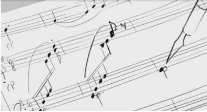
Кадр из молодёжного анимационного фильма «Муза»

Это фильм-эксперимент в стиле лёгкой буффонады, в котором участники школьного театрального коллектива впервые пробуют себя в кино.