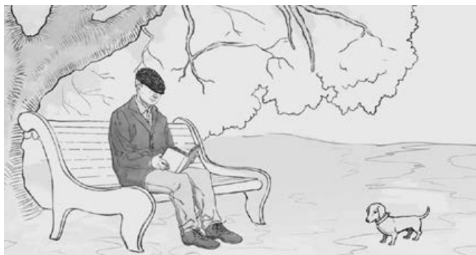
Кадр из фильма «Чудо», лауреата молодёжной секции фестиваля

В конкурсном фильме «Чудо» знаменитый создатель мультфильмов Владимир Григорьевич Сутеев сам стал анимационным персонажем.