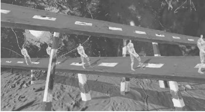
Кадр из стереофильма «Формула агрессии»