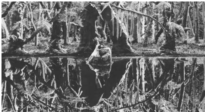
Кадр из стереофильма «Остров любви»

Это история о ребёнке-аутисте. Девочка Даин отправляется в путешествие, чтобы впервые в жизни увидеть свою маму.