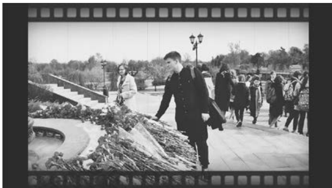
Кадр из молодёжного документального фильма «Мы помним»

Фильм «Мы помним» дополнительно отмечен организационным комитетом фестиваля, а его авторы получили ценный подарок от компании Romanoff.