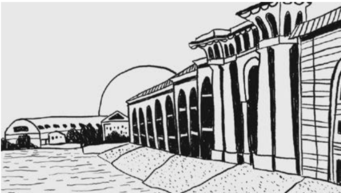
Кадр из молодёжного анимационного фильма «Эмигранты»

В фильме предпринята творческая попытка понять, что такое муза для художника.