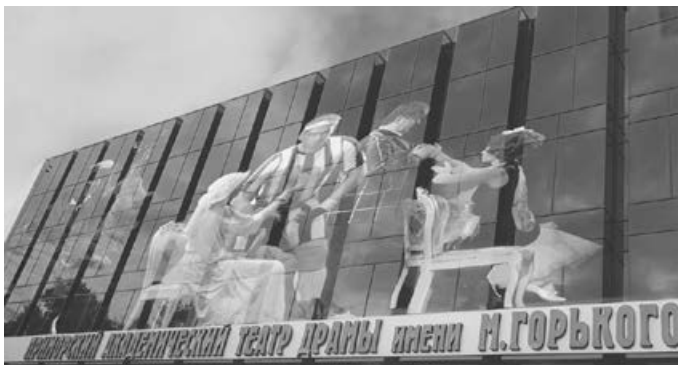
Кадр из стереофильма «Театр папы / Дети драмы»

Во Владивостоке с давних пор жили музыканты, художники, актёры. Жили вместе, работали вместе. Очень хотели почёта, успеха, понимания и славы. Таков обычай. Кто они? Приморский академический краевой драматический театр имени Максима Горького. В театре выросло несколько поколений артистов. Сформировались даже актёрские династии.