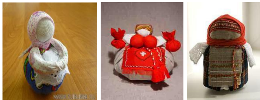
Рисунок 2 – Варианты сувенирной продукции