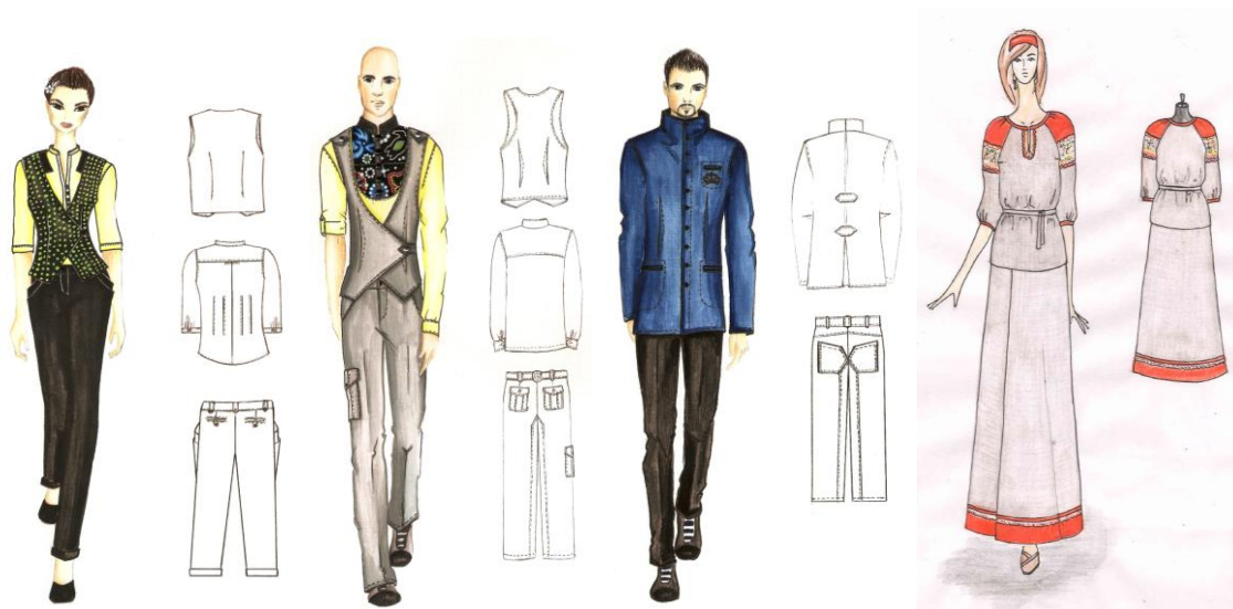
Рисунок 1 - Варианты моделей из льняных тканей ООО «Вяземский льнокомбинат».\

Также была выполнена научно – исследовательская работа, которая связана с исследованием свойств валяной ткани (на примере комплекта) с целью разработки дизайн - проекта коллекции на базе ОАО «Комплект».