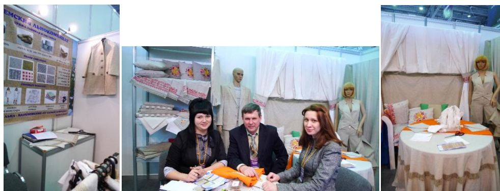
Рисунок 3 – Стенд ООО «Вяземский комбинат» на Текстильлегпроме

Войлок является исконно русским материалом распространенным уже по всему миру, но исторически «рожденным» в России. ОАО «Комплект» является крупнейшим предприятием по производству изделий из войлока. По заказу данного предприятия было проведено исследования свойств отечественного войлока и разработаны модели изделий из него. На рисунке 4 представлены эскизы моделей обуви, одежды и аксессуаров из современных войлочных тканей.