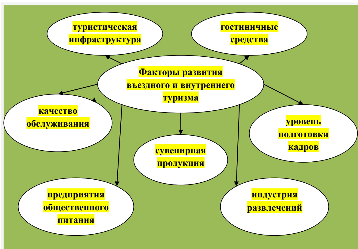
Рисунок 3 – Основные факторы, влияющие на развитие въездного и внутреннего туризма в Подмосковье

На рисунке 3 представлены основные факторы, влияющими на развитие въездного и внутреннего туризма в Подмосковье [4].