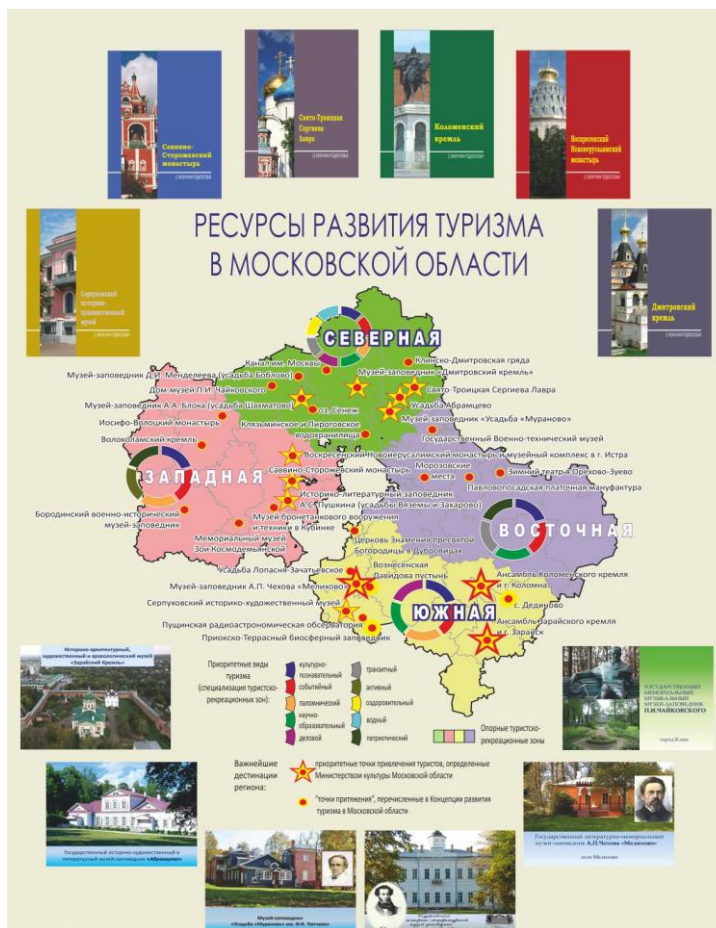
Рисунок 2 – Схема двенадцать «точек притяжения» туристов «12 жемчужин Подмосковья»* *Цифрами обозначены различные объекты туристского сервисного пространства Подмосковья