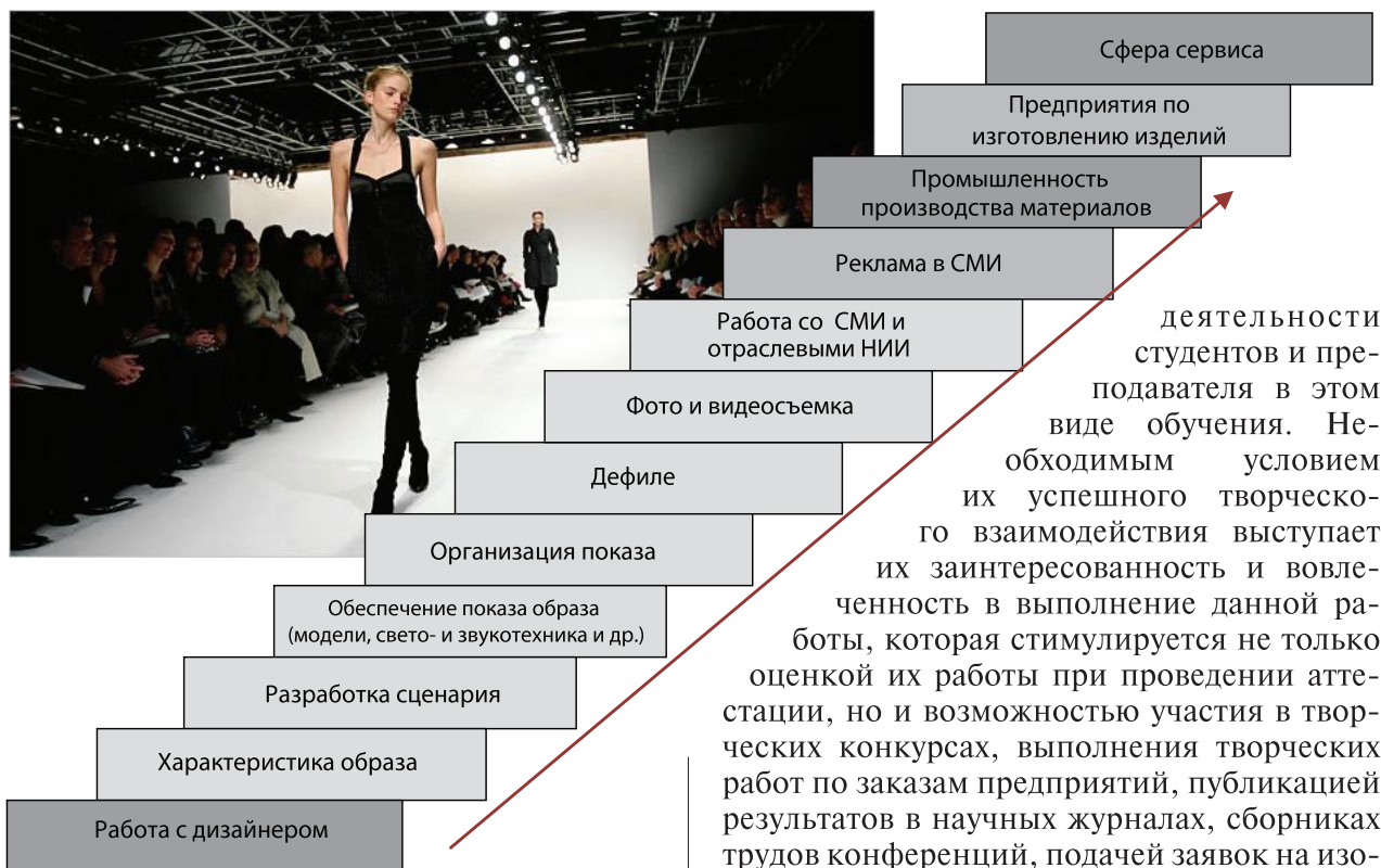
Рис. 1. Алгоритм формирования потребности в одежде в индустрии моды

нализации производственных систем, дизайну и решению психофизиологических проблем в работе с потребителем.