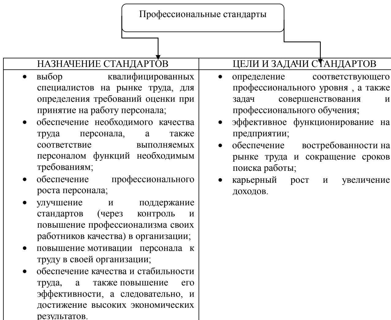
Рисунок 2 - Назначение, цели и задачи профессиональных стандартов

Рассматривая новые профессиональные стандарты следует отметить назначение, цели и задачи, которые они реализуют (рисунок 2).