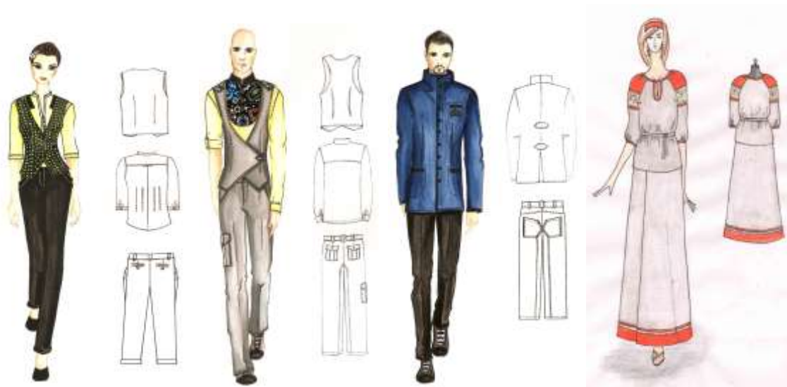
Рисунок 1 - Варианты моделей из льняных тканей ООО «Вяземский льнокомбинат».\