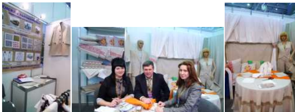
Рисунок 3 – Стенд ООО «Вяземский комбинат» на Текстильлегпроме

Войлок является исконно русским материалом распространенным уже по всему миру, но исторически «рожденным» в России. ОАО «Комплект» является крупнейшим предприятием по производству изделий из войлока. По заказу данного предприятия было проведено исследования свойств отечественного войлока и разработаны модели изделий из него. На рисунке 4 представлены эскизы моделей обуви, одежды и аксессуаров из современных войлочных тканей.