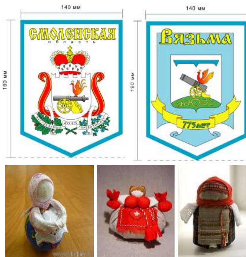
Рисунок 2 – Варианты сувенирной продукции