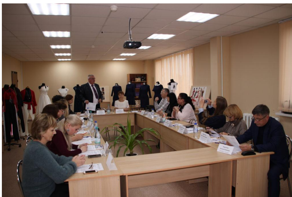
Рисунок 3 – Рабочий момент Регионального круглого стола г.Можайск