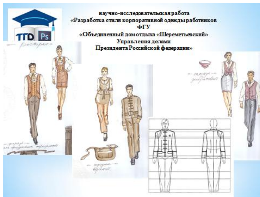
Рисунок 6 - Оздоровительный комплекс «Шереметьевский» — парк-отель

Современные тенденции развития образования в мире [2] определяют ряд наиболее важных тенденций, таких как: