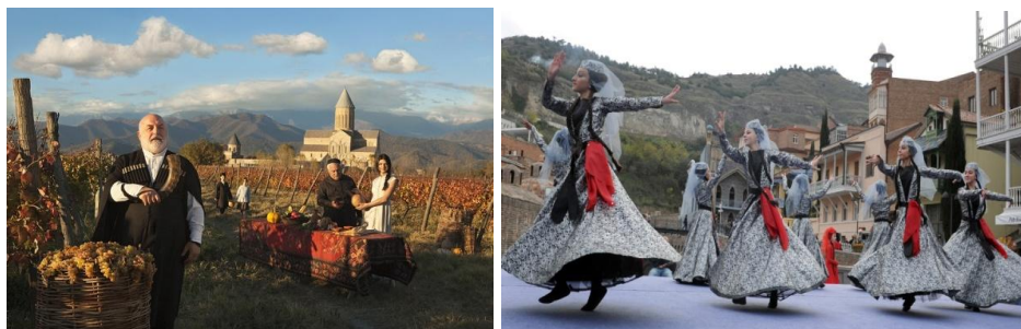
Рисунок 12 - Исторические памятники и национальные праздники Грузии

Пример использования национальной одежды в туристском бизнесе на примере знакомства с национальной культурой, кухней, традициями другой страны рассмотрим Грузию. Народы Грузии всегда славились своим национальной культурой, традициями и замечательной кухней. Грузия богата историческими памятниками и множеством национальных праздников (Мцхетоба-Светицховлоба, Нинооба, Тамароба, Денб Святого Георгия, Тбилисоба, Чиакоконоба и другие). На рисунке 12 представлены некоторые исторические места и праздничные мероприятия проводимые в них, где хорошо видны костюмы участников празднеств.