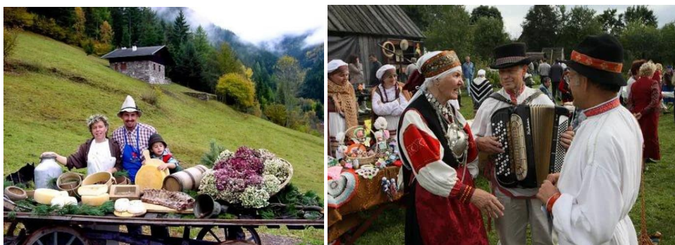
Рисунок 14 – Варианты эксклюзивного туристского продукта и услуг в Норвегии

Из представленных примеров использования в туристской индустрии эксклюзивности туристских продуктов и услуг различных стран и регионов в мире наглядно видно широкое использование национальной одежды, что привлекает туристов и позволяет распространяться национальным и культурным ценностям.