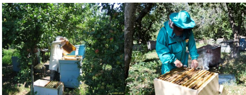
Рисунок 10 – Комплект пчеловода

Также в России всегда в усадьбах имела пасека. Это позволяло обеспечивать хозяевам себя медом и широко использовались также лечебные свойства меда и пчелотерапию. Поэтому данный туристский продукт пользуется большой популярностью. Апитерапия и лечение пчелами получила широкую популярность во всем мире, благодаря своим натуральным методам оздоровления организма. Принципиальных изменений костюм пчеловода не претерпел. Его одежда комплектовалась из маски-шляпы, перчаток, куртки, штанов и ботинок, из натуральных материалов и не темные, так как плел это раздражает.