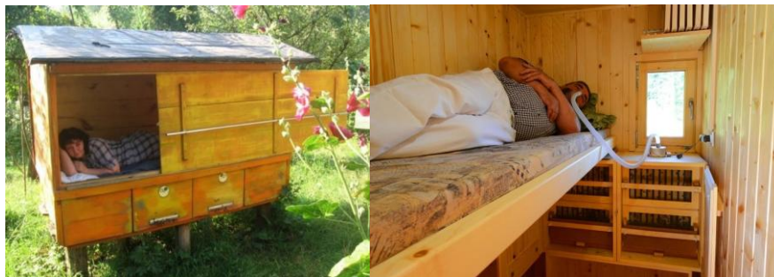
Рисунок 11 – Варианты пчелотерапии

Пчелотерапия предполагает использование пчелиного яда, продуктов пчеловодства и процесса жизнедеятельности самих пчел. На рисунке 11 представлены варианты пчелотерапии, которыми может воспользоваться турист.