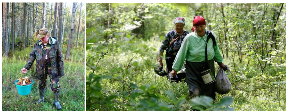
Рисунок 9 – Вариант мужского и женского современного костюма грибника - ягодника

Поэтому, если предлагать туристский продукт и услугу как сбор ягод и грибов, то следует предоставить туристам соответствующие комплектации, представленные на рисунке 9.