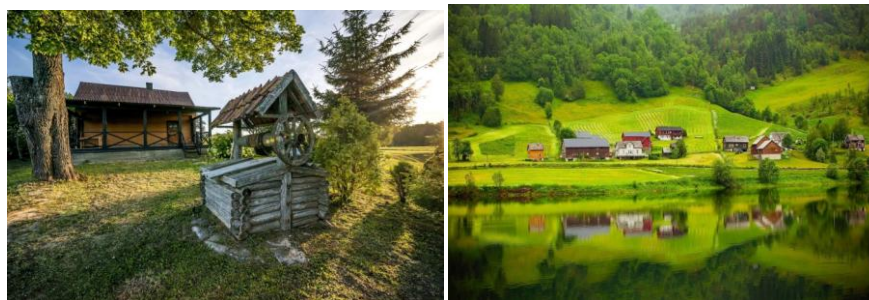
Рисунок 13 – Внешний вид сельской усадьбы в Норвегии