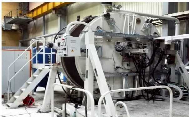
Рис. 1. Установка центробежного распыления нового поколения УЦРТ-9

томатики (КБХА, г. Воронеж) и ОАО «Композит» (г. Королев) также получен ряд новых интересных решений.