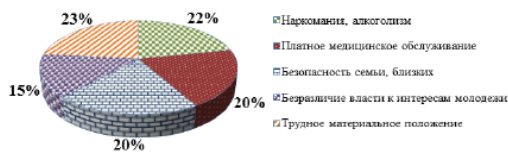
Рисунок 1 - Проблемы студенчества 90-х годов

Рассмотрим некоторые проблемы студенчества 90-х годов на рисунке 1.