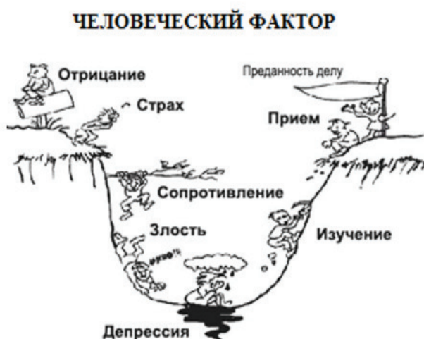
Рисунок 2 – Человеческий фактор

Наглядно человеческий фактор можно представить следующим образом (рисунок 2):