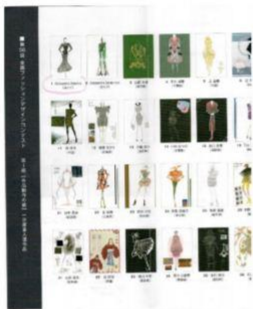
Рис. 1 – Буклет к конкурсу студенческих работ Fashion design contest 2018 год