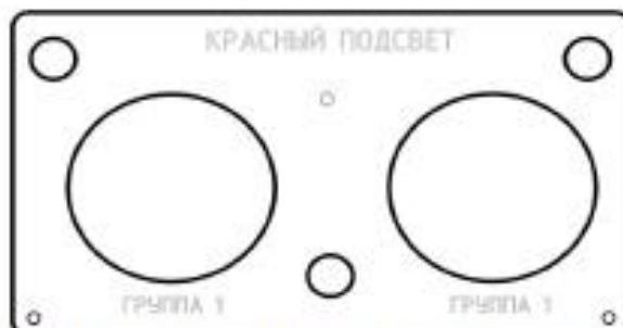
Рис. 2 – Пример готового чертежа панели тренажера МТВ-2 Ми-8 под вырезку