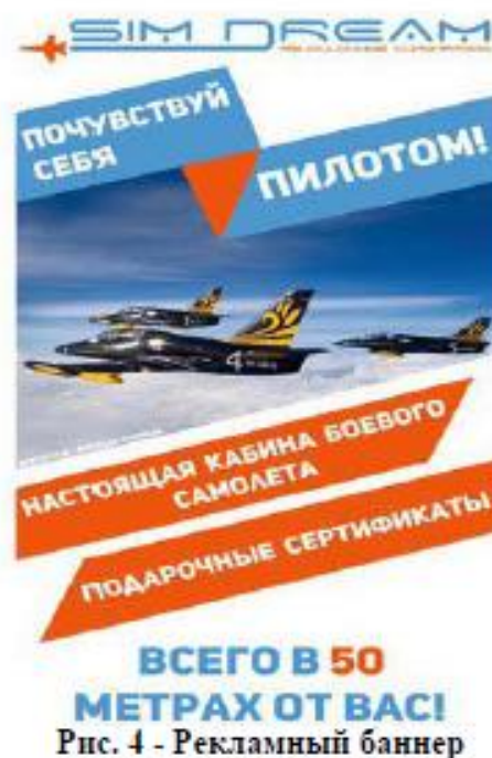
Рис. 4 - Рекламный баннер

Так же мной был разработан проект рекламной продукции, содержащий в себе дизайн двух рекламных плакатов, один из которых должен был находиться в павильоне компании, а другой в вестибюле торгового центра, рис. 4.