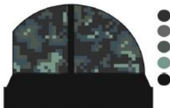
Рис. 3 – Пример 2D визуализации дизайна купола тренажера Albatros L-39