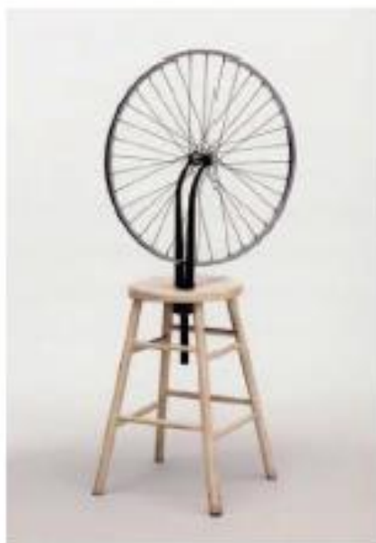
Рисунок 1 – Марсель Дюшан. Велосипедное колесо. 1951 год [6]