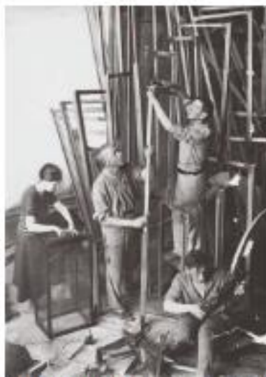
Рисунок 2 – Владимир Татлин (в центре) за работой над памятником III Коммунистического интернационала. 1919 год [6]

Объектно-предметный тип инсталляции может быть в виде научной лаборатории и какой-либо музейный интерьер.