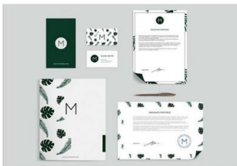
Рисунок 5 – Фирменный стиль компании «М» [8]