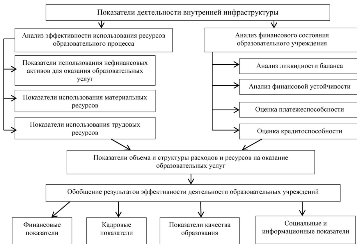
Рис. 1 – Система показателей эффективности деятельности образовательного учреждения

Определение последовательности выполнения аналитических исследований является исходной позицией с точки зрения теории и практики анализа эффективности хозяйственной деятельности [2, с. 65]. По мнению Г.В.Савицкой и А.Д.Шеремета, построение последовательности анализа составляет основу методики анализа хозяйственной деятельности.