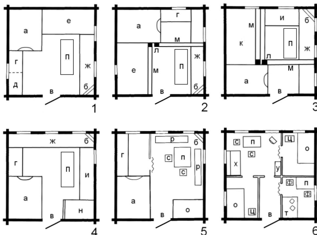
Рис. 2. Архитектурно-эстетические компоненты интерьера мордовского народного жилища при южнорусской (1, 2), западнорусской (3), среднерусской (4, 5) и нетрадиционной (6) планировках

От внутренней планировки в значительной степени зависело решение интерьера мордовского народного жилища (рис. 2).