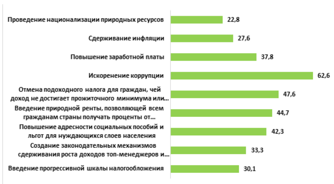
Рисунок 1 – Меры, способствующие уменьшению социального неравенства (%)