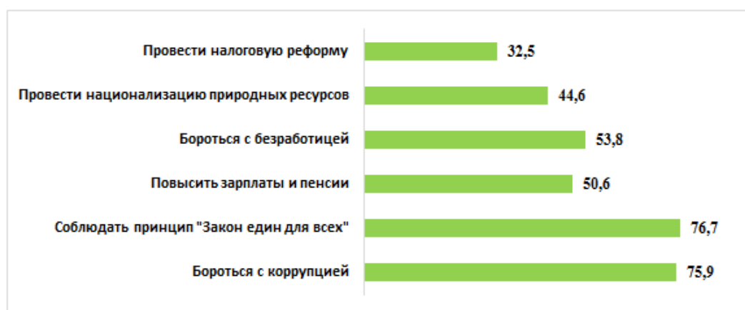
Рисунок 6 – Действия государства, необходимые для того, чтобы сделать общество более справедливым (%)

Было интересно посмотреть, какие факторы, по мнению респондентов, в большей мере влияют на достижение человеком высокого экономического статуса (рисунок 7).