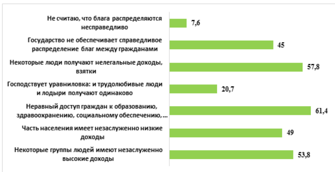
Рисунок 5 – Причины несправедливого распределения благ (%)