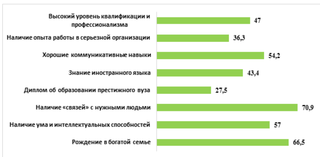
Рисунок 7 – Факторы, влияющие, в первую очередь, на достижение человеком высокого экономического статуса (%)

Подводя итоги, можно сказать, что исследование социального неравенства в нашей стране не теряет своей актуальности. В целом респонденты признают, что социальное неравенство, было, есть и будет всегда, так как люди не равны по своей природе. Но, при этом полагают, что социальное расслоение не должно быть слишком значительным. С сильным социальным расслоением необходимо бороться, так как оно негативно сказывается на развитии экономики. Молодые люди считают, что максимально допустимый уровень различия в доходах между богатыми и бедными должен быть не более чем в 2-4 раза. При этом, большая часть участников опроса полагает, что за последние несколько лет разрыв между богатыми и бедными в нашей стране только увеличился.