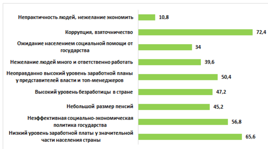
Рисунок 2 – Основные причины социального неравенства в России (%)

Более половины респондентов (69%) беспокоит проблема социального неравенства, уровень которого оказывает влияние на взаимоотношения граждан. Так, 88% респондентов полагают, что в российском социуме имеет место быть неприязнь между богатыми и бедными (сумма ответов «да» и «скорее да»). Так же более половины участников опроса (55%) считают, что существует неприязнь к конкретным социальным классам. В первую очередь к власти (чиновникам, политикам, депутатам) (11,6%); к богатым (олигархам, предпринимателям, бизнесменам) (10,1%); к бедным (9,5%). В то же время сами молодые люди в большинстве своем заявляют о том, что для них материальное положение не имеет значения, они могут общаться и дружить с людьми как более обеспеченными, так и менее обеспеченными.