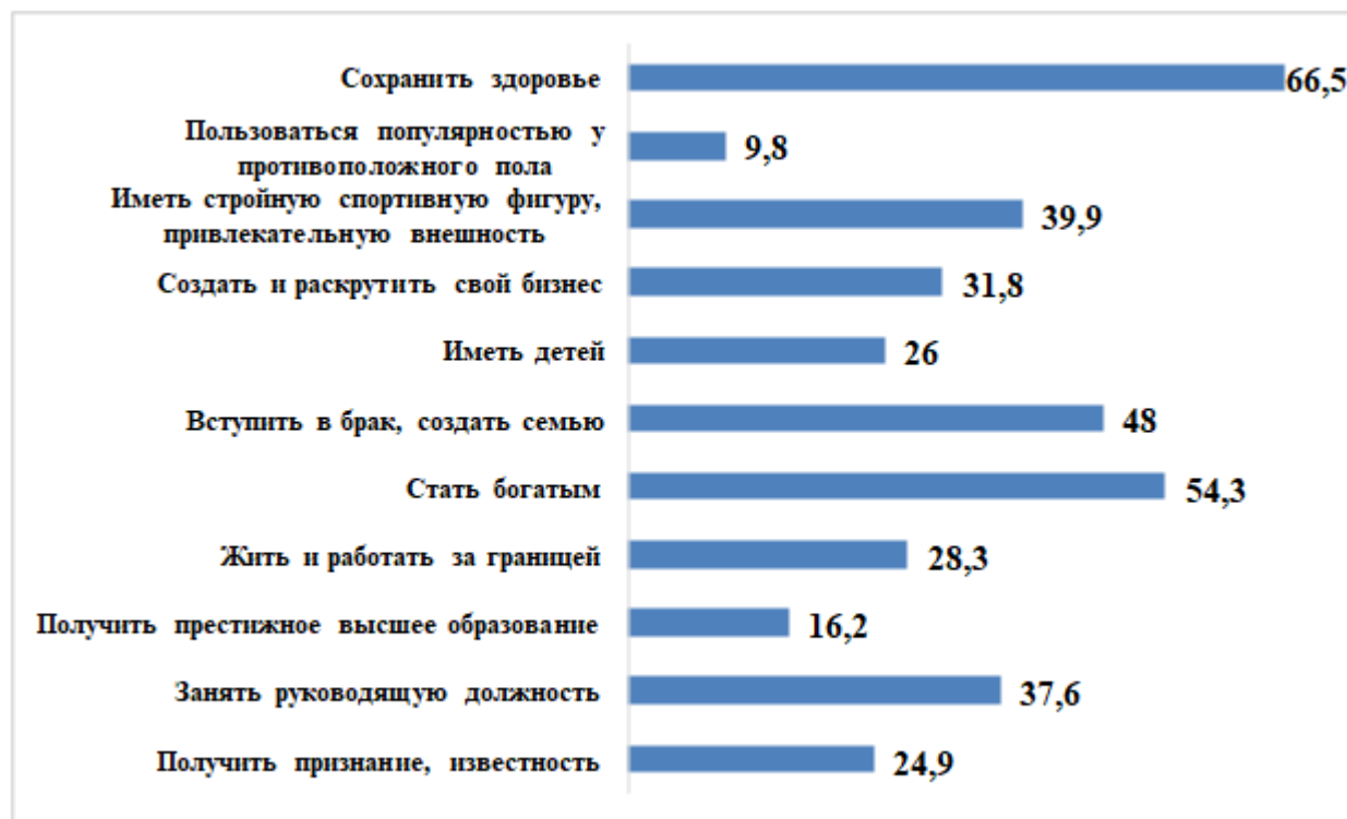
Рисунок 1 – Позиции, которые необходимо добиться молодым людям для того, чтобы чувствовать себя успешным (%)

время является наличие стройной спортивной фигуры и привлекательной внешности (39,9%). Далее в рейтинге следовали такие позиции как «занятие руководящей должности» (37,6%) и создание и раскрутка своего бизнеса (31,8%). Интересно отметить, что связывали успешность в жизни с получением престижного высшего образования только 16,2% респондентов (см. рисунок 1).