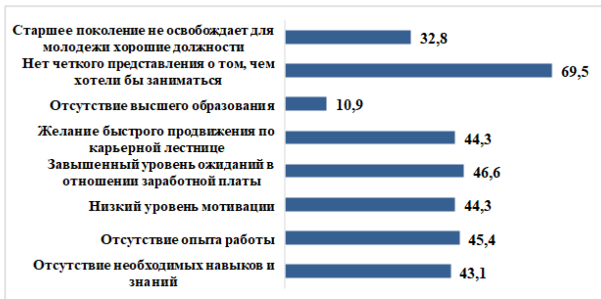
Рисунок 8 – Факторы, мешающие молодёжи реализовать свои профессиональные амбиции, построить карьеру (%)

Подводя итоги, стоит сказать, что в основном, мотивация профессионально-трудовой деятельности связана с возможностью достижения финансового благополучия. Современные молодые люди недостаточно осознанно выбирают сферу профессиональной деятельности и учебное заведение. Так как в будущем многие готовы работать не по специальности, и не считают высшее образование залогом будущей успешной работы. Тем не менее, для достижения материального благополучия они готовы прилагать значительные усилия, в частности повышать квалификацию и перерабатывать.