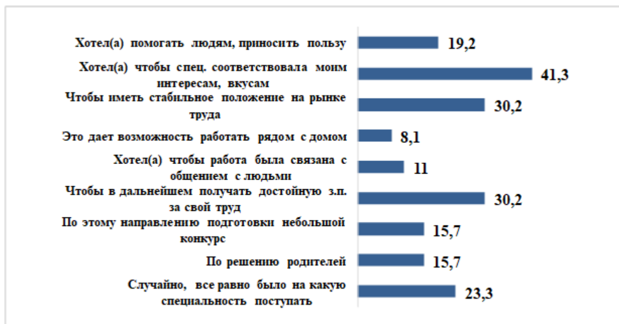
Рисунок 5 – Критерии, по которым молодые люди выбирали специальность для обучения (%)

бюджетных мест (40,6%). Все это может свидетельствовать о не очень осмысленном выборе абитуриентами места обучения (см. рисунок 6).