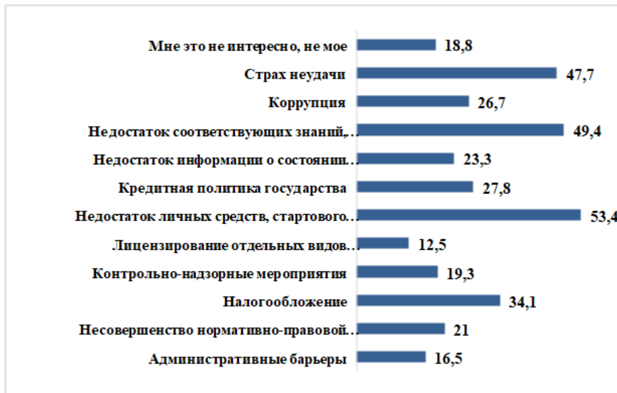
Рисунок 4 – Факторы, препятствующие занятию предпринимательской деятельностью (%)

В ходе опроса была, предпринята попытка выяснить, что для респондентов является главными факторами, препятствующими занятию предпринимательской деятельностью. Были получены следующие ответы: недостаток личных средств, стартового капитала (53,4%), недостаток соответствующих знаний, умений и навыков (49,4%), страх неудачи (47,7%), налогообложение (34,1%) и кредитная политика государства (27,8%). Более подробная информация представлена на рисунке 4.