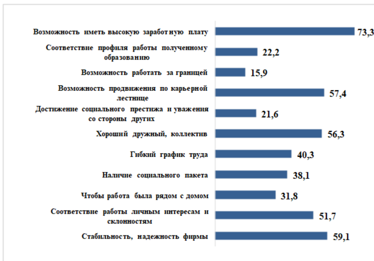
Рисунок 7 – Факторы, влияющие на выбор места работы (%)

Ведущим мотивирующим фактором трудовой деятельности для респондентов выступает финансовая составляющая. Более половины опрошенных (63,6%) сказали, что продолжили бы работать, даже если бы у них был пассивный источник дохода, который позволял бы им достойно жить и не нуждаться в деньгах (например, жилье, которое можно сдавать или наследство). Более половины участников опроса (57,4%) полагают, что если они будут работать больше или более качественно, то их заработная плата вырастет.