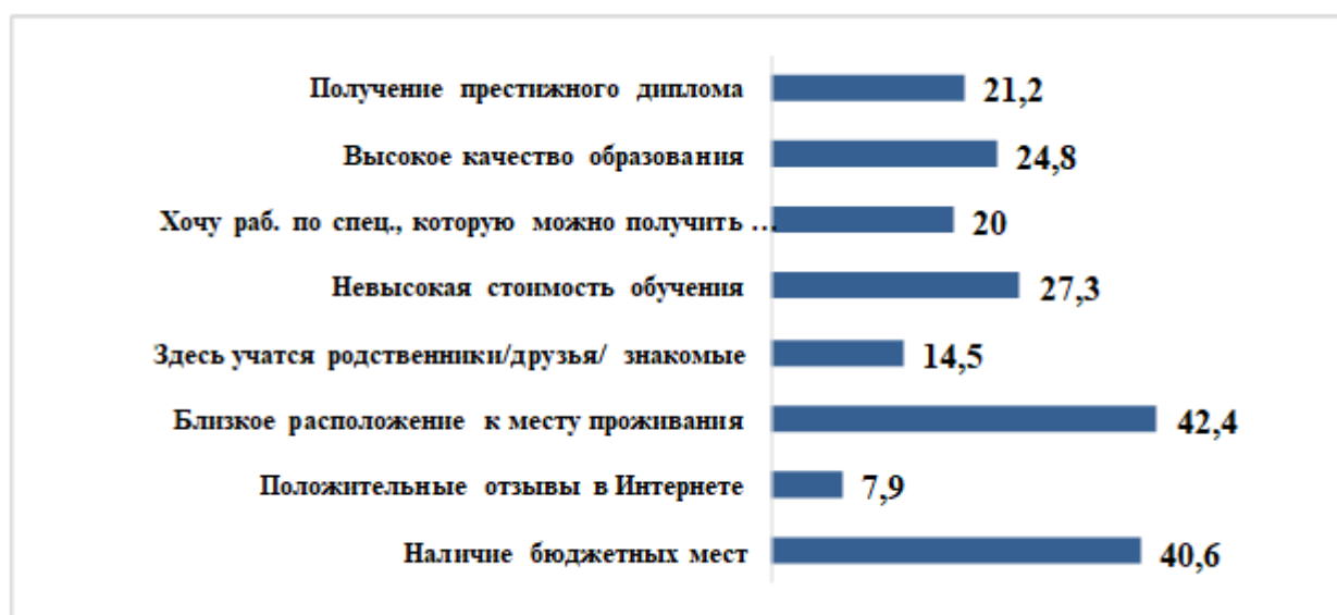
Рисунок 6 – Критерии, по которым молодые люди выбирали учебное заведение (%)

В ходе исследования авторы попытались узнать, что для молодых людей является главным при выборе места работы. Самой популярной в рейтинге оказалась позиция – «возможность иметь высокую заработную плату» (73,3%). Также более половины респондентов отметили такие факторы как «стабильность, надежность фирмы» (59,1%), «возможность продвижения по карьерной лестнице» (57,4%), «хороший дружный, коллектив» (56,3%). Только каждый пятый респондент назвал такие факторы как соответствие профиля работы полученному образованию» (22,2%). Более подробная информация представлена на рисунке 7.