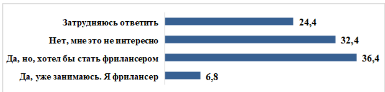
Рисунок 3 – Отношение респондентов к занятию фрилансом (%)

Молодежь активно осваивает новые формы и ниши профессиональной деятельности. Так, каждый третий представитель молодого поколения хотел бы заниматься фрилансом (36,4%), но только 6,8% реально освоили этот вид заработка. Несмотря на все возрастающую популярность фриланса в современном мире 32,4% респондентов, сказали, что им это не интересно, а 24,4% – затруднились с ответом (см. рисунок 3). Более половины опрошенных (54,5%) полагают, что занятие фрилансом позволяет обеспечить достойный уровень жизни.