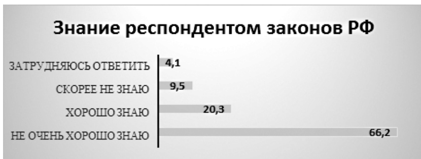
Рисунок 2 – Распределение респондентов на вопрос: «Знаете ли Вы законы РФ?»» (в % от общего числа опрошенных)

Приятно отметить, что две трети респондентов не встречались с нарушением законодательства в РФ (66,2%) и немногим менее одной трети респондентов встречались с подобными ситуациями (29,7%).