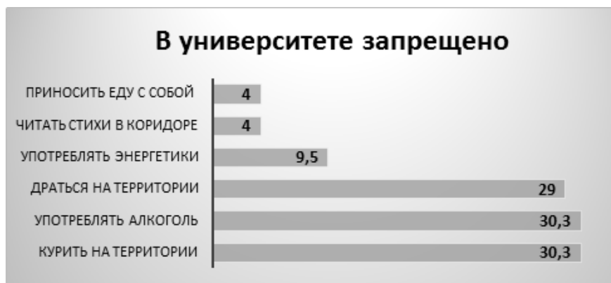
Рисунок 5 – Распределение респондентов на вопрос: «Что запрещено в университете?» (в % от общего числа опрошенных)

Важным аспектом адаптации иностранных студентов является наряду с комфортным проживанием в стране уверенная образовательная деятельность в стенах университета. Для этого необходимо не только знать законы страны пребывания, но и локальные нормативно-правовые акты, например, устав учебного заведения. Треть опрошенных справедливо отметили, что на территории университета нельзя курить, употреблять алкоголь и устраивать драки (рис.5).