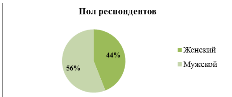
Рисунок 1. Распределение респондентов по полу (в % от общего числа опрошенных)

Объём выборки: 74 респондента в возрасте от 18 до 27 лет. Гендерный состав: 34% респондентов женского пола и 66% – мужского пола (рис.1).