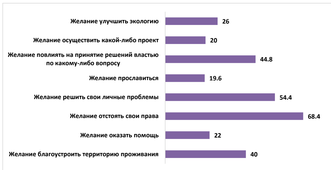
Рисунок 3 – Причины, способные побудить россиян участвовать в общественной жизни (%)

Рассмотрим теперь более подробно некоторые виды активности россиян.