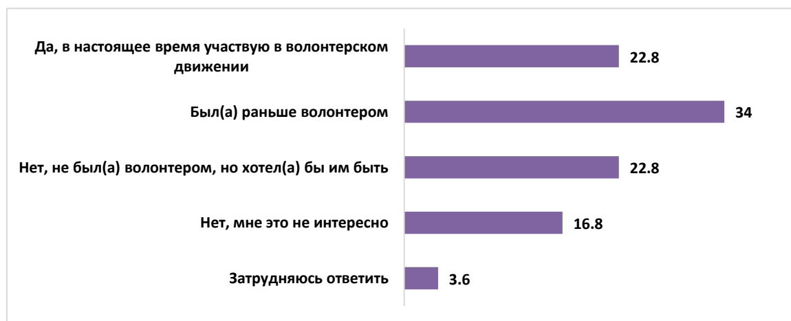
Рисунок 5 – Отношение к волонтерскому движению (%)

Несмотря на не очень высокую вовлеченность в участие в благотворительных акциях, россияне очень положительно оценивают деятельность волонтеров. Так, в настоящее время каждый пятый опрошенный (22,8%) являлся участником волонтерского движения. Каждый третий (34%) был волонтером в прошлом. Каждый пятый (22,8%) хотел бы стать волонтером. Только 16,8% респондентов сказали, что им это не интересно (см. рис. 5).