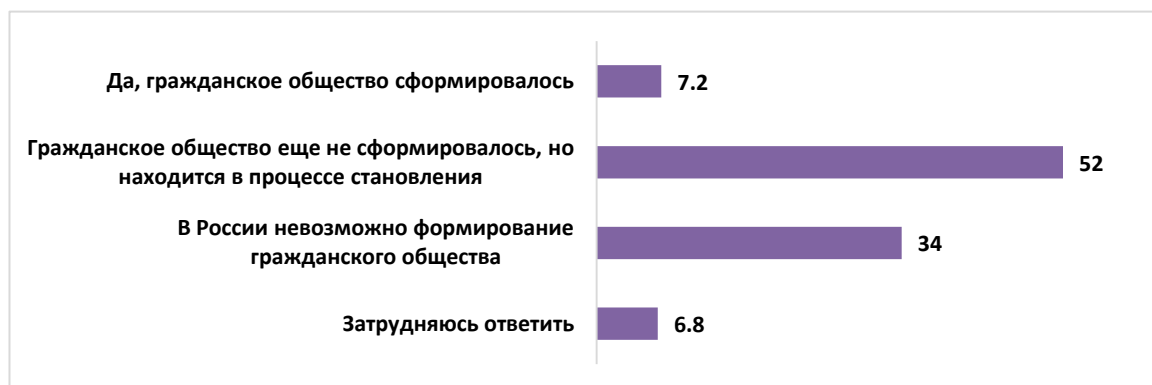
Рисунок 1 – Отношение россиян к формированию гражданского общества в России (%)

Стоит начать с того, что не только ученые спорят о том, существует ли гражданское общество в РФ. Среди опрошенных нами россиян также нет единой точки зрения на этот вопрос. Так, более половины респондентов (52%) считают, что гражданское общество в России еще не сформировалось и находится в процессе становления. Треть опрошенных (34%) по данному вопросу настроены еще более критически и полагают, что в нашей стране невозможно формирование гражданского общества (см. рис. 1).