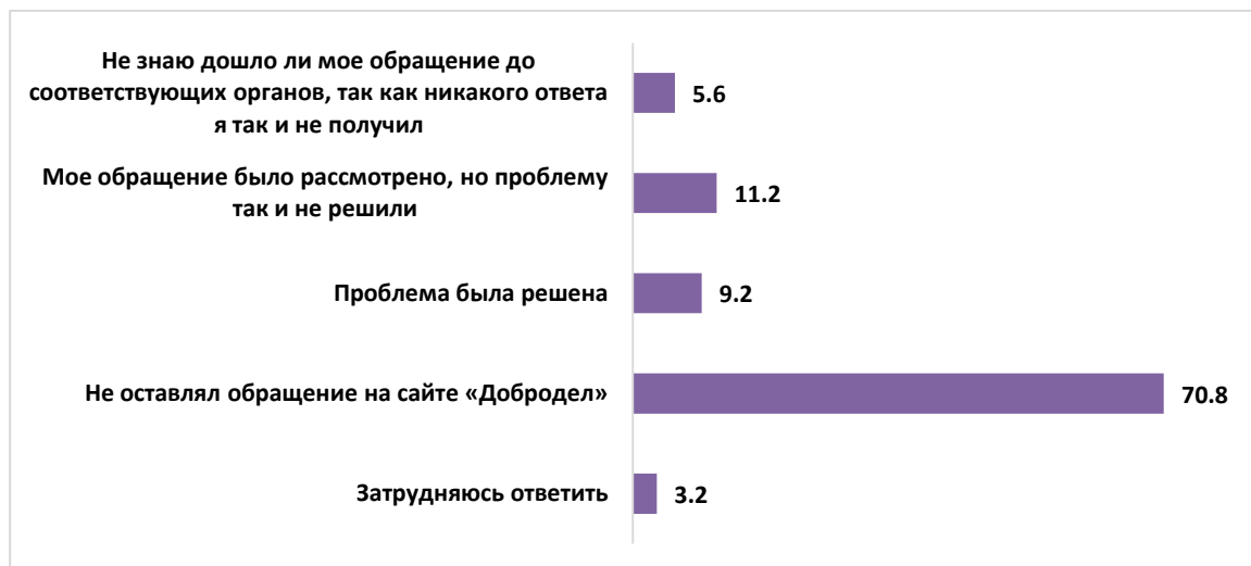
Рисунок 8 – Результаты обращения к властям через сайт «Добродел» (%)

Несмотря на то, что сейчас легче всего взаимодействие осуществлять по средствам сети Интернет, только каждый четвертый (24,4%) респондент зарегистрирован на сайте «Добродел». Большая часть опрошенных (74%) не зарегистрирована на этом портале. Соответственно только 22% участников анкетирования писали на сайте «Добродел» о своей проблеме. 9,2% респондентов сообщили, что их проблема была решена. 11,2% участников анкетирования сказали, что их обращение было рассмотрено, но проблему так и не решили (см. рис. 8).