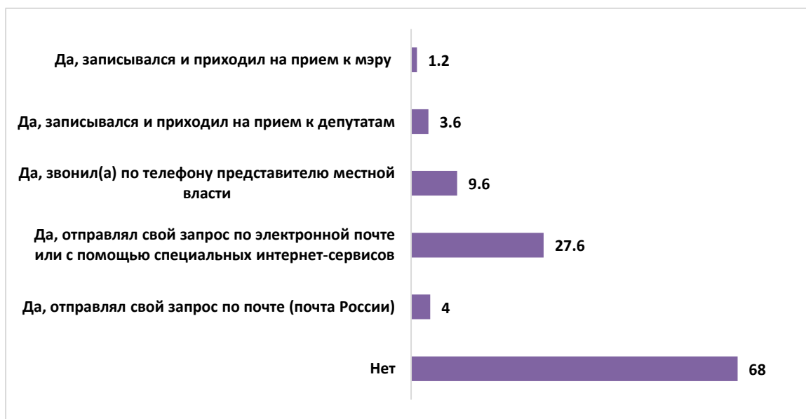
Рисунок 6 – Способы взаимодействия с властью (%)

Еще одним аспектом проблемы формирования гражданского общества в России является взаимодействие населения с органами власти. Эмпирические данные исследования свидетельствуют, что более половины участников анкетирования (68%) никогда не обращались к представителям муниципальной власти с каким-либо вопросом или проблемой. Самым распространенным и удобным для респондентов способом общения с представителями власти является отправление своего запроса по электронной почте или с помощью специальных интернет-сервисов. Им воспользовались 27,6% опрошенных. Только 1,2% участников опроса записывался и приходил на прием к мэру, 3,6% – к депутатам. Почти каждый десятый (9,6%) звонил по телефону представителям местной власти и 4% отправляли свой запрос по почте (почта России) (см. рис. 6).