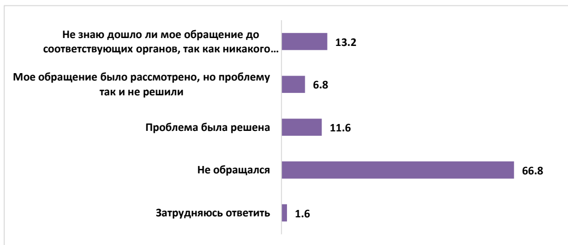
Рисунок 7 – Результаты обращения к представителям власти (%)

Результаты исследования свидетельствуют о достаточно низком уровне активности взаимодействия населения с представителями местной власти. Это подтверждает и тот факт, что 74% респондентов никогда не участвовали в публичных слушаниях по важным проблемам муниципалитета.