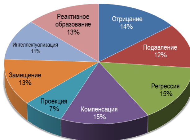
Рисунок 1. Обобщенная структура использования участниками исследования различных видов защит

По методике УСК определен уровень общей интернальности испытуемых. Далее сравнили результаты с нормой 5,5 стенов. Отклонение вправо (6 и более стенов) свидетельствует об интернальном типе уровня субъективного контроля в соответствующих ситуациях, отклонение влево (5 и менее стенов) свидетельствует об экстернальном типе.