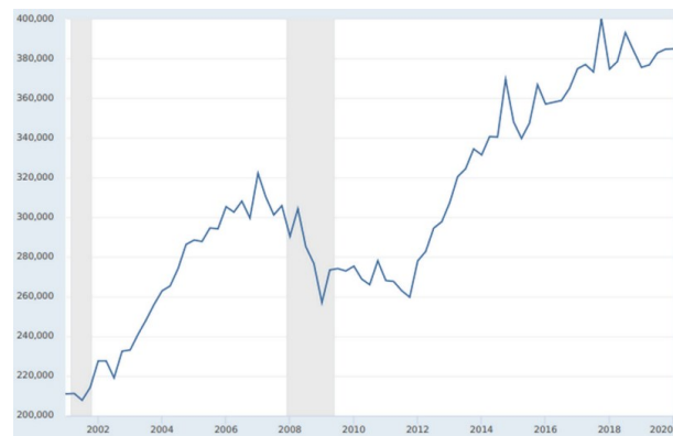
Рис. 2. Средняя цена домов, проданных в США, в долларах ($) [3]

Основной причиной финансового кризиса послужили обеспеченные долговые обязательства – CDO (Collateralized Debt Obligations), а также массовые дефолты, которые наступили по данным обеспеченным долговым обязательствам. Рынок же недвижимости был перегружен предложениями, на продажу выставлялись сотни тысяч домов.