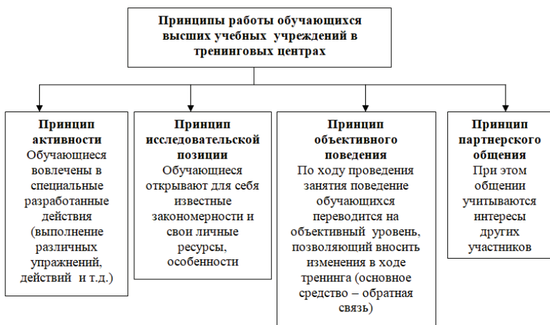
Рис. 1 – Основные принципы работы обучающихся в тренинговых группах

Проведение подобных занятий поможет установить между обучающимся и преподавателем отношения сотрудничества и взаимного уважения, что позволит повысить эффективность процесса обучения. Кроме этого, данная форма занятий позволит развить у обучающихся способность взаимодействовать и общаться с людьми, что является важным навыком для современного специалиста.