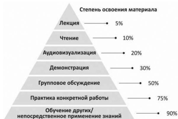
Рис. 1. Пирамида обучения

В течение молодежной смены преподаватели университета старались вооружить участников форума не только теоретическими зна-