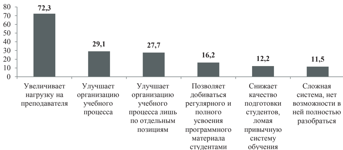
Рис. 2. Отношение преподавателей к балльно-рейтинговой системе

Несмотря на уже имеющийся опыт работы с балльно-рейтинговой системой, в целом опрошенные оценивают ее неоднозначно. Многие считают, что она увеличивает нагрузку на преподавателя. Вместе с тем почти треть оценивает опыт использования системы как положительный, позволяющий изменить организацию учебного процесса в лучшую сторону, а 16,2 % считает, что данная система позволяет студентам лучше усваивать изученный материал. Значит, высокая нагрузка могла бы быть оправданной при достойной оплате [3].