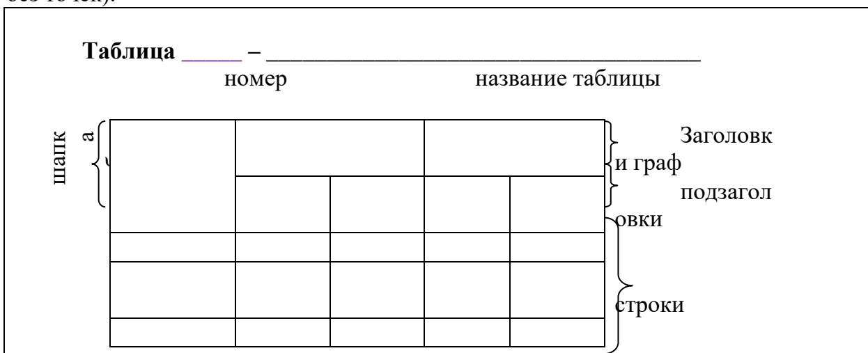
Рисунок 1 – Оформление цифрового материала

Таблицы применяют для лучшей наглядности и удобства сравнения показателей. Название таблицы, при его наличии, должно отражать ее содержание, быть точным, кратким. Название следует помещать над таблицей (шрифт 14, жирный, без точек).