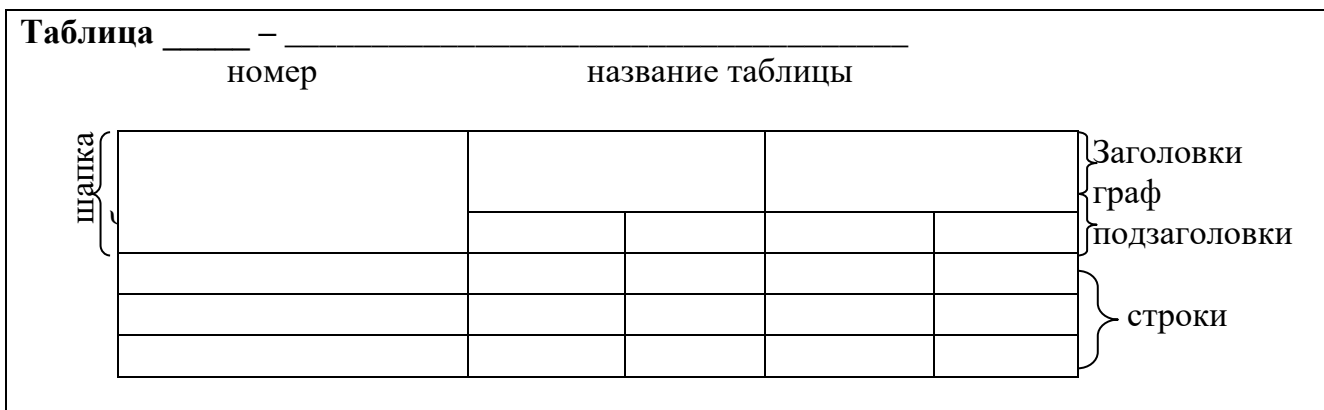
Рисунок 2 – Оформление цифрового материала

Цифровой материал, как правило, оформляют в виде таблиц в соответствии с рисунком 2.