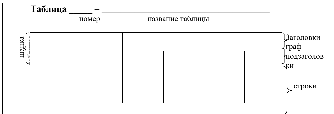
Рисунок 1 – Оформление цифрового материала

Цифровой материал, как правило, оформляют в виде таблиц в соответствии с рисунком 1 .