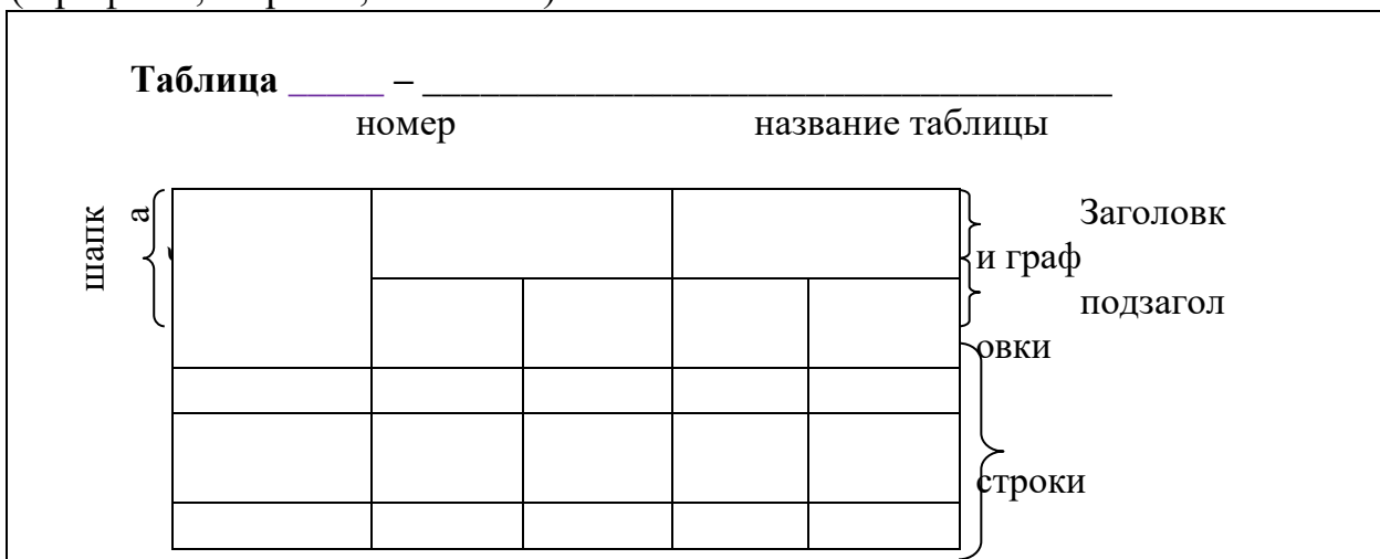
Рисунок 1 – Оформление цифрового материала

Таблицы применяют для лучшей наглядности и удобства сравнения показателей. Название таблицы, при его наличии, должно отражать ее содержание, быть точным, кратким. Название следует помещать над таблицей (шрифт 14, жирный, без точек).