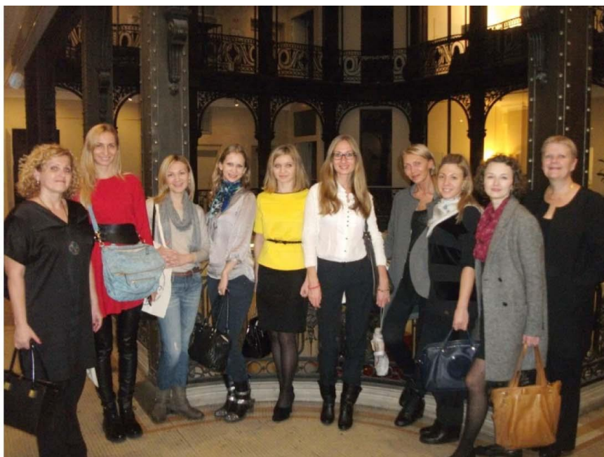
Рисунок 3 – Стажировка во французском офисе школы ESMOD International

После прохождения обучения студенты получают диплом о профессиональной переподготовки или сертификат о повышении квалификации.