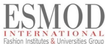
Рисунок 1 – Логотип школы дизайна ESMOD INTERNATIONAL Fashion Institutes & Universities Group

В Москве, Российский Государственный Университет им. А.Н. Косыгина с 2006 года является официальным и эксклюзивным представителем французской школы дизайна ESMOD INTERNATIONAL Fashion Institutes & Universities Group в России, логотип компании представлен на рисунке 1.